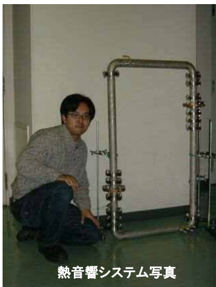
熱音響システム写真

熱音響技術を応用した熱音響システムは、入力エネルギー源を選ばないことが最大の長所である。つまり、太陽熱エネルギーなどの自然エネルギー、自動車や工場などの廃熱を入力エネルギー源として利用することができる。その他にも、地球環境の破壊につながる有毒な充填ガスを用いる必要がないこと、可動部が無く構造が簡単のため信頼性が高いことなどが長所として挙げられる。一方、現状において、システムの形状の自由度が低いことやエネルギー変換効率が低いことなどが課題として残る。これらを解決し、システムの実用化を目指して研究を進めている。