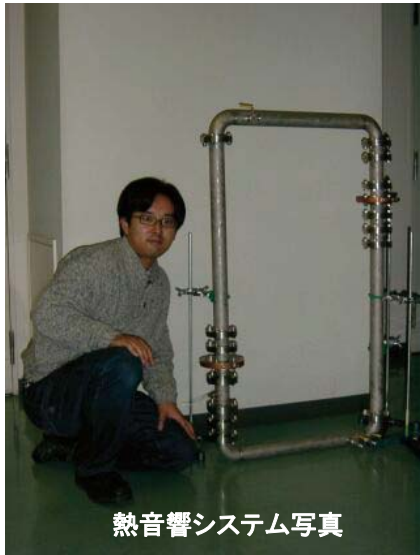
熱音響システム写真

熱音響技術を応用した熱音響システムは、入力エネルギー源を選ばないことが最大の長所である。つまり、太陽熱エネルギーなどの自然エネルギー、自動車や工場などの廃熱を入力エネルギー源として利用することができる。その他にも、地球環境の破壊につながる有毒な充填ガスを用いる必要がないこと、可動部が無く構造が簡単のため信頼性が高いことなどが長所として挙げられる。一方、現状において、システムの形状の自由度が低いことやエネルギー変換効率が低いことなどが課題として残る。これらを解決し、システムの実用化を目指して研究を進めている。