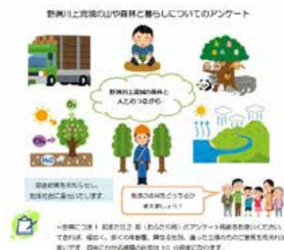
森林関連活動の森林幸福度への影響