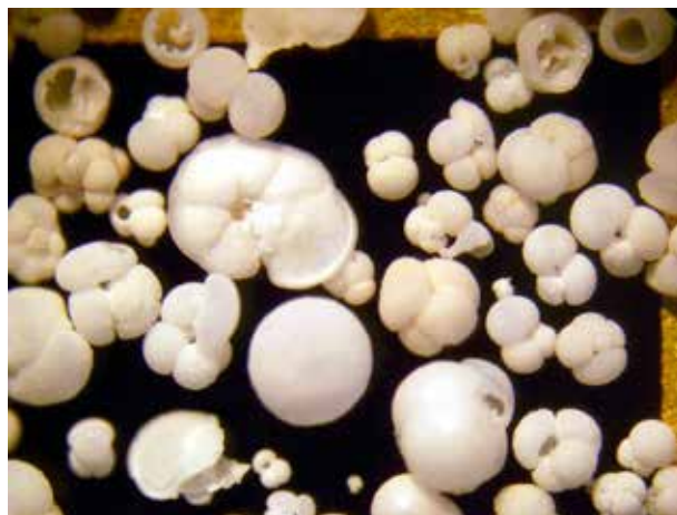
海底堆積物から拾い出した浮遊性有孔虫化石

海底コア試料に含まれる浮遊性有孔虫化石を分析し、日本列島周辺海域における表層水環境の成立過程を調べています。