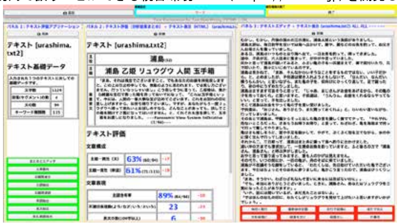
図1 TETDMによるテキスト分析結果の表示例

データの有効活用を見込むニーズに対して、本統合環境をカスタマイズして、多様な目的に活用できます。