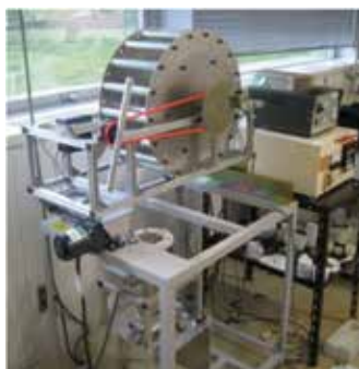
2点曲げ強度試験のためのガラスファイバー作製装置