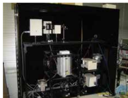
高温融液用分光光度計

本研究室では、室温以下から 1800 K までの広い温度範囲で、様々な物性の測定方法の開発とその組成依存性・同位体比依存性を調べている。具体的には、融液状態では酸化還元特性・比熱・粘性・放射熱伝達特性（光吸収特性）・密度・水の挙動について、また室温付近以下では熱伝導率や比熱についての研究に取り組んでいる。